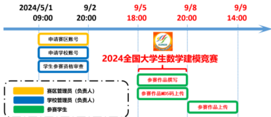
图1 2024全国大学生数学建模竞赛时间示意图

赛区组委会、参赛学校和参赛队报名注册与参赛的相关事项、时间节点及说明如图1和表1所示。