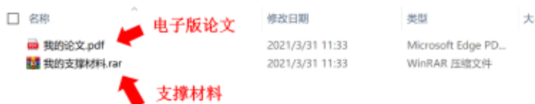
图2 电子版论文文件示意图

(3) 如需提交支撑材料，参赛论文应与支撑材料分开，以两个独立文件（如图2）的形式分别通过客户端对应功能提交。